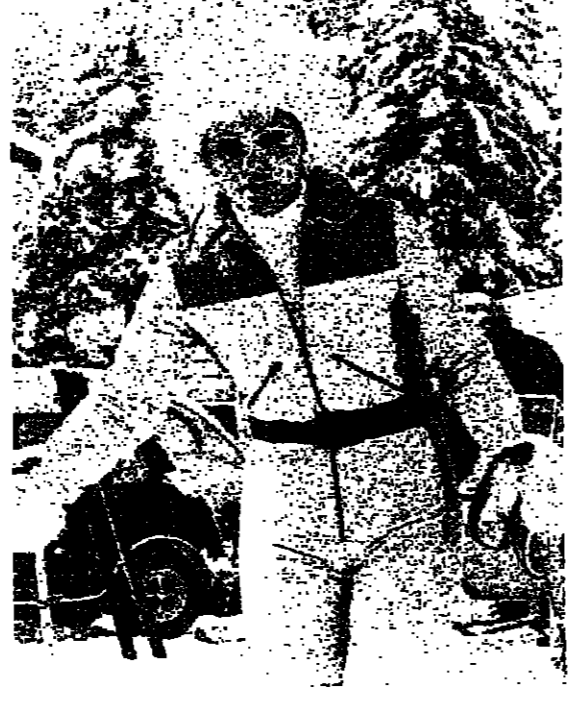
الابراجورة فرح تتراجم في سان موريتز